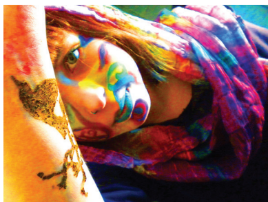
Figura 6 6

La concepción de posmodernidad es una visión que puede considerarse problemática, pues no se trata de un término que haya sido aceptado en su totalidad. De hecho, existen autores que han descartado pensar en lo posmoderno como una categoría en la medida en que conciben la época actual “como un súper-desarrollo de lo moderno” (Osborne, 2010, p. 153). Aun así, si persistiéramos en esta denominación, la denegación de lo moderno en el contexto contemporáneo se aprecia como uno de los puntos más sobresalientes de esta concepción. Si pudiésemos subsumir el enfoque de educación artística en la posmodernidad bajo esta visión, quizás podríamos afirmar que la sensibilidad estética situada en el contexto escolar se articularía como una fuerza de oposición a la normativa. Una conciencia en torno a las formas de denegación de lo posmoderno que se traducirían en la producción visual como un conjunto articulado de oposiciones a diferentes formas de comunicación, expresión, transmisión de valores y simbolizaciones de las formas precedentes de producción de obras artísticas.