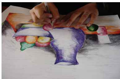
Figura 2 2

En el aula se utiliza una programación sistemática de los conocimientos artísticos que pretende el logro de resultados formales previamente aceptados por una comunidad académica que los valida. Se espera que la obra visual ejecutada evidencie un resultado preestablecido, por sobre la necesidad expresiva personal del creador, bajo una continua supervisión por parte del docente. Ante este enfoque, la experiencia estética posee ciertos rasgos que pueden ser ligados a una predominancia de la racionalidad, tanto instrumental como conceptual, dirigida a explorar los fenómenos sensibles en tanto estímulos perceptuales situados en la visión más concreta y menos interpretativa.