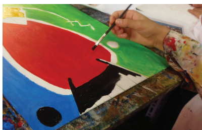
Figura 4 4

Este enfoque permite al estudiante expresar su interioridad emocional procurando, además, resolver o, al menos, dialogar con sus preocupaciones. Para tales efectos, el estudiante plantea sus emociones y preocupaciones para luego definir las; el docente genera preguntas y/o situaciones para contribuir a la verbalización y formalización de los sentimientos individuales; luego, el estudiante determina visualmente, a través de distintos medios, sus sentimientos y emociones, favoreciendo una riqueza interpretativa de su sentir. Probablemente sea este enfoque el que más se ajusta a un imaginario colectivo que concibe la percepción subjetiva, la experimentación con el material, la imaginación individual y el procedimiento talentoso como medios de entrada a la creación sensible. La experiencia estética se sustenta en gran parte sobre las decisiones del sujeto, quien explora en las