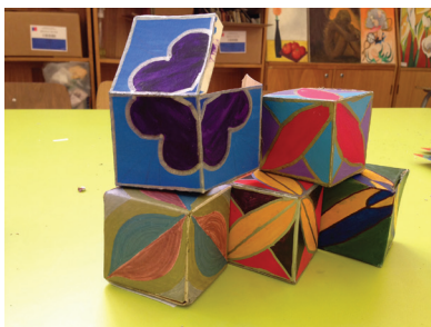
Figura 3 3

La principal fortaleza de este enfoque es su potencial aplicabilidad en función de necesidades específicas, tales como la coherencia entre mensaje y forma, la solución de un problema visual o funcional en relación a una armonía o equilibrio, como también el reconocimiento de innovaciones que satisfagan las necesidades cotidianas. Sus límites probablemente apuntan al énfasis que se le dé a la funcionalidad comunicativa u operacional, que pueden condicionar el desarrollo de habilidades que pueden dejar fuera el desarrollo de habilidades con predominancia en lo expresivo.