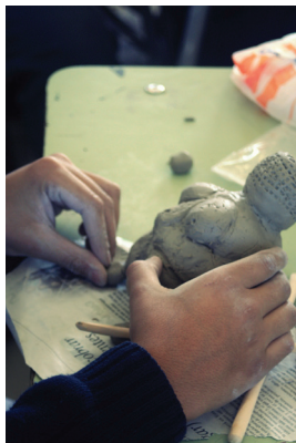
Figura 1 1

Por otra parte, el docente asume un rol de modelador que potencia el que los estudiantes reproduzcan estrategias técnicas y procedimientos, cumpliendo una suerte de papel de “maestro” de la producción artística. En este rol, es necesario ofrecer retro-alimentaciones constantes al evaluar las actuaciones de los aprendices, las decisiones en torno a la producción de obra y las concepciones erróneas que se lleven a cabo en el transcurso del proceso de enseñanza y aprendizaje.