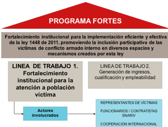
Gráfico 2. Programa FORTES.

En el marco de lo acordado entre el gobierno de la República de Colombia y la República Federal de Alemania, por intermedio del Ministerio Federal de Cooperación Económica y Desarrollo (BMZ), en octubre del año 2014 se da inicio al Programa Fortalecimiento estructural de la asistencia e integración de desplazados internos en el Departamento de Caquetá (FORTES). Ejecutado por la Agencia Alemana para la Cooperación Internacional (Deutsche Gesellschaft für Internationale Zusammenarbeit) (GIZ en adelante), teniendo a la Gobernación del Caquetá como contraparte política a nivel regional y la Alcaldía de Florencia la contraparte técnica a nivel local (véase Gráfica 2).