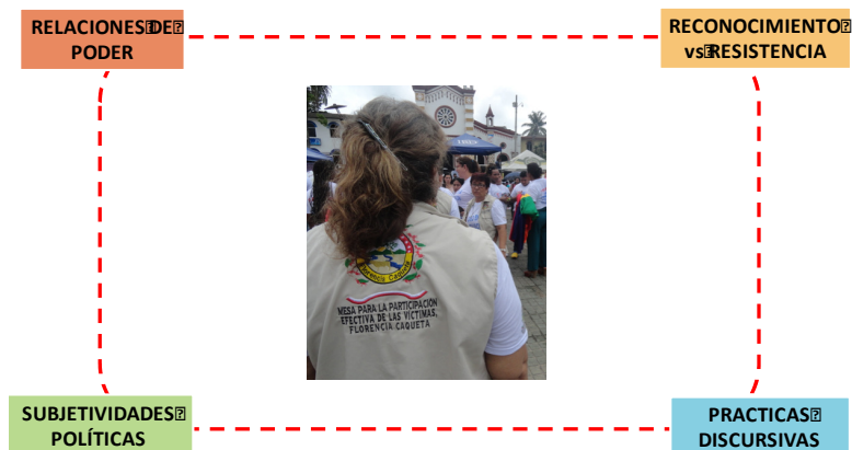
Gráfico 1. Mapa Mental. Referentes teóricos.

La presente Propuesta Educativa para el Agenciamiento Social se deriva del trabajo de investigación adelantando en la Maestría en Educación y Desarrollo Humano, tiene como objetivo: Comprender las formas de participación y la Capacidad de Agencia en las narrativas de representantes de víctimas, y su lugar en la implementación de Políticas Públicas para su Atención, Asistencia y Reparación Integral en la Ciudad de Florencia (Caquetá).